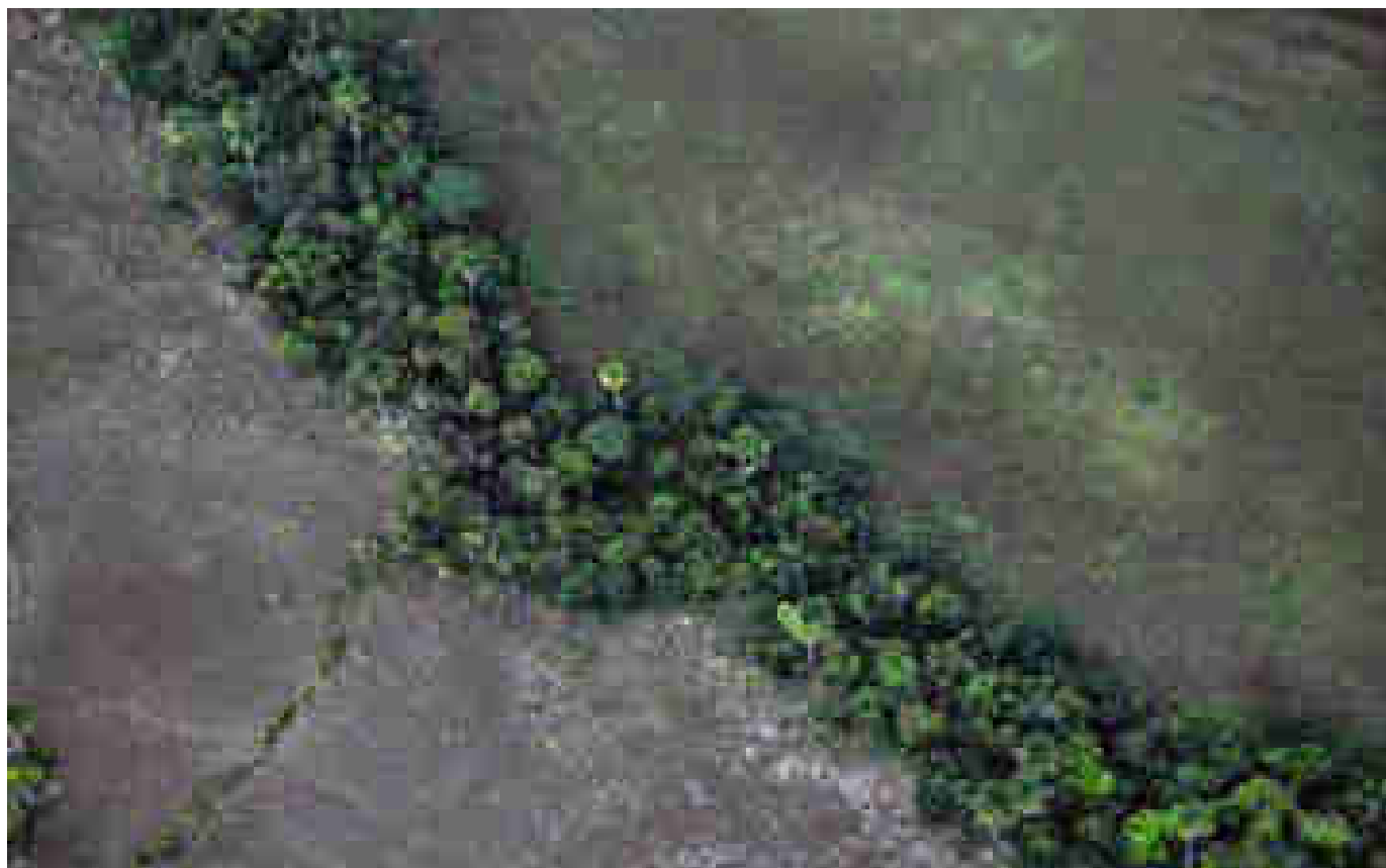
Jour du dépassement : la Terre vit à crédit dès ce lundi