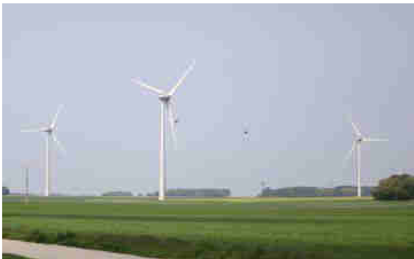
Jour du dépassement : cinq gestes pour sauver la planète