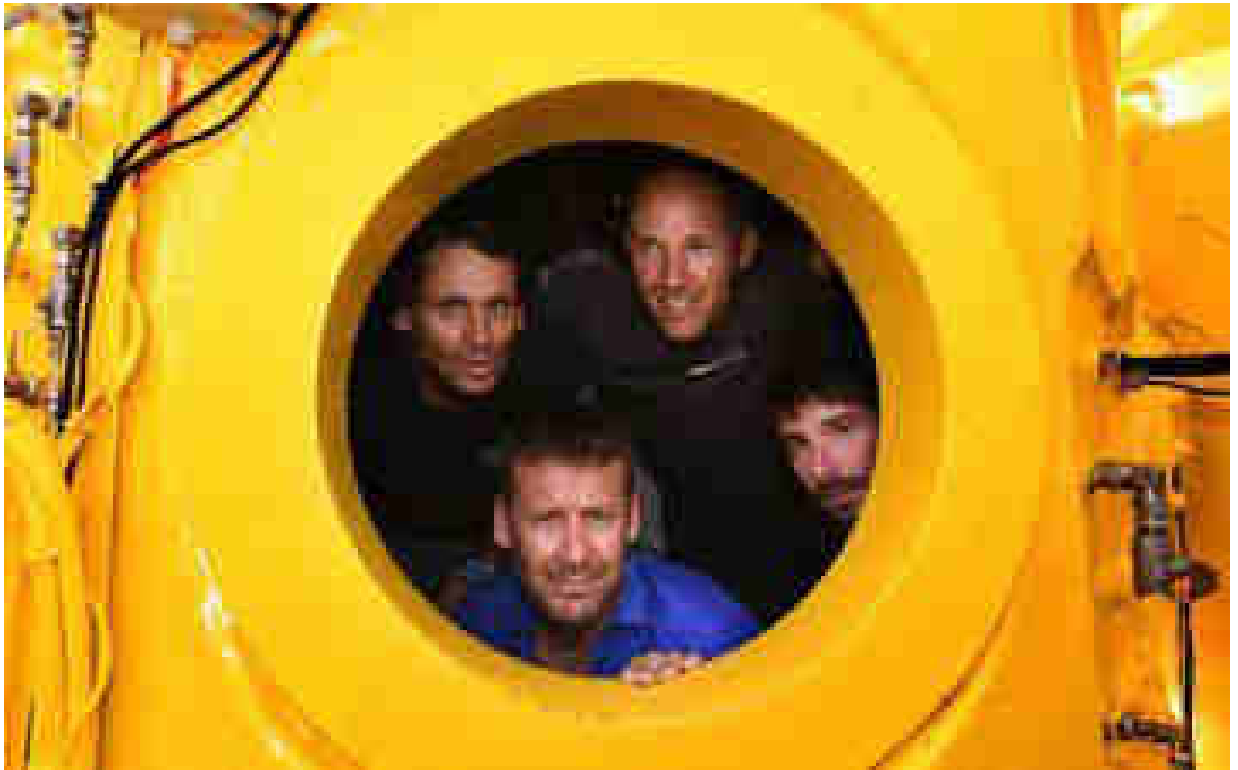
«Planète Méditerranée» : après 28 jours par 120 mètres de fond, l'expédition revient à la surface