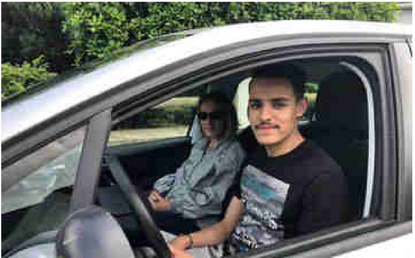
Ces Parisiens qui partent en province pour passer leur permis